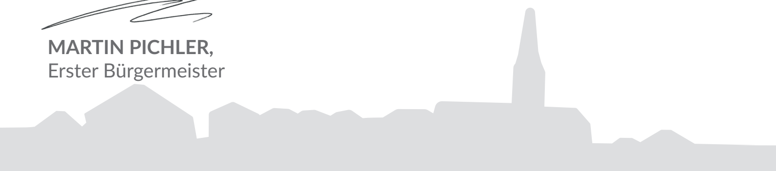
MARTIN PICHLER, Erster Bürgermeister

Die neuaufgelegte Broschüre soll Privateigentümer bei Sanierungsvorhaben beratend unterstützen und inhaltliche Hilfestellungen geben. Neben den fachlichen Ratschlägen wird insbesondere auf die finanziellen Zuschüsse für Sanierungs- und Aufwertungsmaßnahmen hingewiesen.