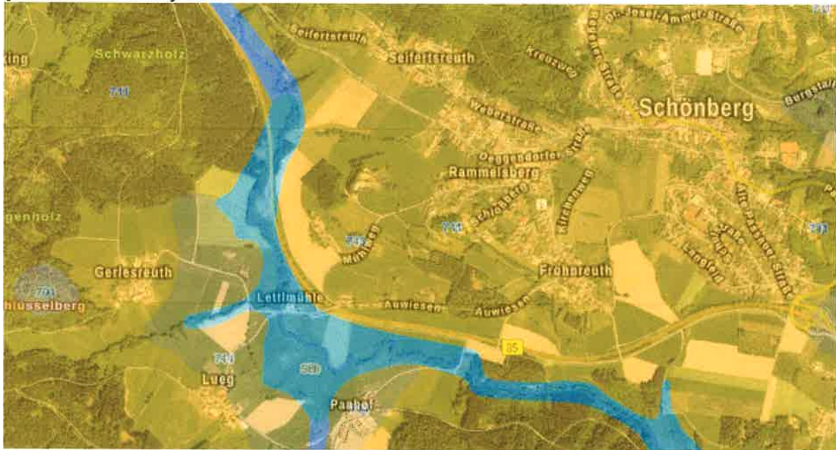
Abbildung 1: Ausschnitt Bodenschätzungskarte

Im Geltungsbereich des Bebauungsplanes kommen gemäß der Bodenschätzungskarte (M 1:25.000) fast ausschließlich Braunerde aus skelettführendem (Kryo-)Sand bis Grussand [Granit oder Gneis] vor.